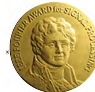
L'IEEE FOURIER AWARD FOR SIGNAL PROCESSING est décerné tous les ans par la plus importante organisation mondiale pour l'avancement technologique au service de l'humanité.

Dans le livre Les mathématiciens de l'antiquité au XXI e siècle (éditions Belin en 2012) est évoqué Joseph Fourier, ainsi que sa protégée Sophie Germain, parmi les génies déclinés. Des figures de diffraction par rayons X nous rappellent que les techniques de l'Optique dite de Fourier ont notamment permis pour la première fois de révéler la structure en double hélice de l'ADN. Une diffraction a lieu lorsqu'une onde rencontre un obstacle d'un