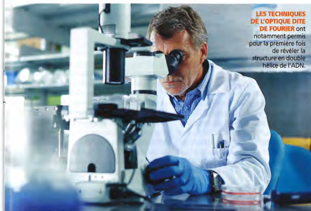
LES TECHNIQUES DE L'OPTIQUE DITE DE FOURIER ont notamment permis pour la première fois de révéler la structure en double hélice de l'ADN.

De nos jours, grâce aux progrès de l'électronique, les TF sont réalisées à l'aide d'analyseurs numériques. Un capteur transforme la grandeur observée en signal électrique. Pour un champ magnétique, une antenne suffit. >