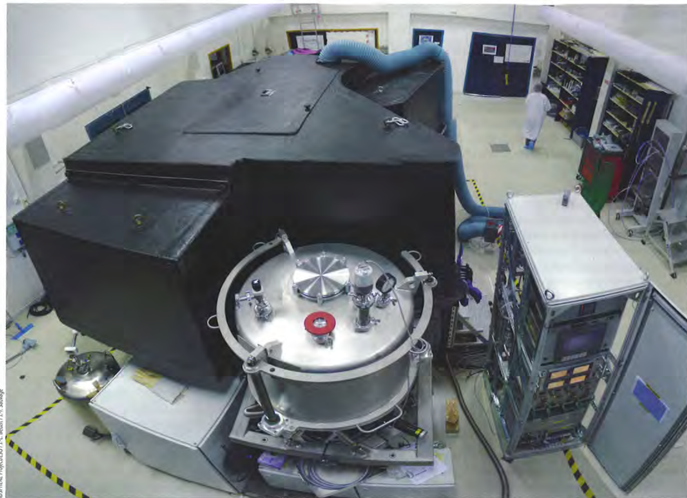
L'IMAGEUR D'EXOPLANÈTES SPHERE (Spectro-Polarimetric High-contrast Exoplanet REsearch) dédié à la recherche systématique ainsi qu'à l'étude d'exoplanètes et installé sur le Très Grand Télescope (VLT) de l'ESO à l'Observatoire du Cerro Paranal dans le désert d'Atacama au Chili. Utilisant l'analyse de Fourier, il permet l'étude des astres dans les longueurs d'onde allant du visible à l'infrarouge.

des fluides, fut élève de Fourier, et tout comme lui bourguignon (Dijon pour Navier, Auxerre pour Fourier). Dans ce numéro, une double page est consacrée à la transformée de Fourier, outil universel pour le traitement du signal (son, lumière, images) et véritable couteau suisse de la physique. Ainsi en va-t-il de l'imagerie médicale, et tout particulièrement de l'IRM.